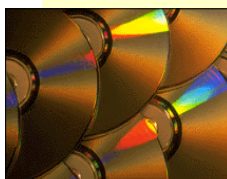
Suport digital de la informació.

En definitiva, la renovació experimentada en els darrers anys en la pràctica i actualització de les noves tècniques, la tipologia dels centres de documentació, l'expansió dels documents i els suports fan necessari comptar amb bons instruments d'accés a la informació. És necessari man-