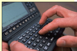
Tractament de la informació.

recerca selectiva automatizada que proporciona la informàtica aplicada a la xarxa.