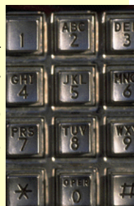
Les noves tecnologies han revolucionat l'accés a les fonts

Els Centres d'informació i de documentació s'han d'adaptar i d'actualitzar per conservar la documentació i posar més a l'abast de l'usuari tota la informació. D'aquí que en la societat de la informació amb una creixent quantitat de documentació disponible, cal conèixer i saber utilitzar les noves formes d'accés i consulta als fons documentals.